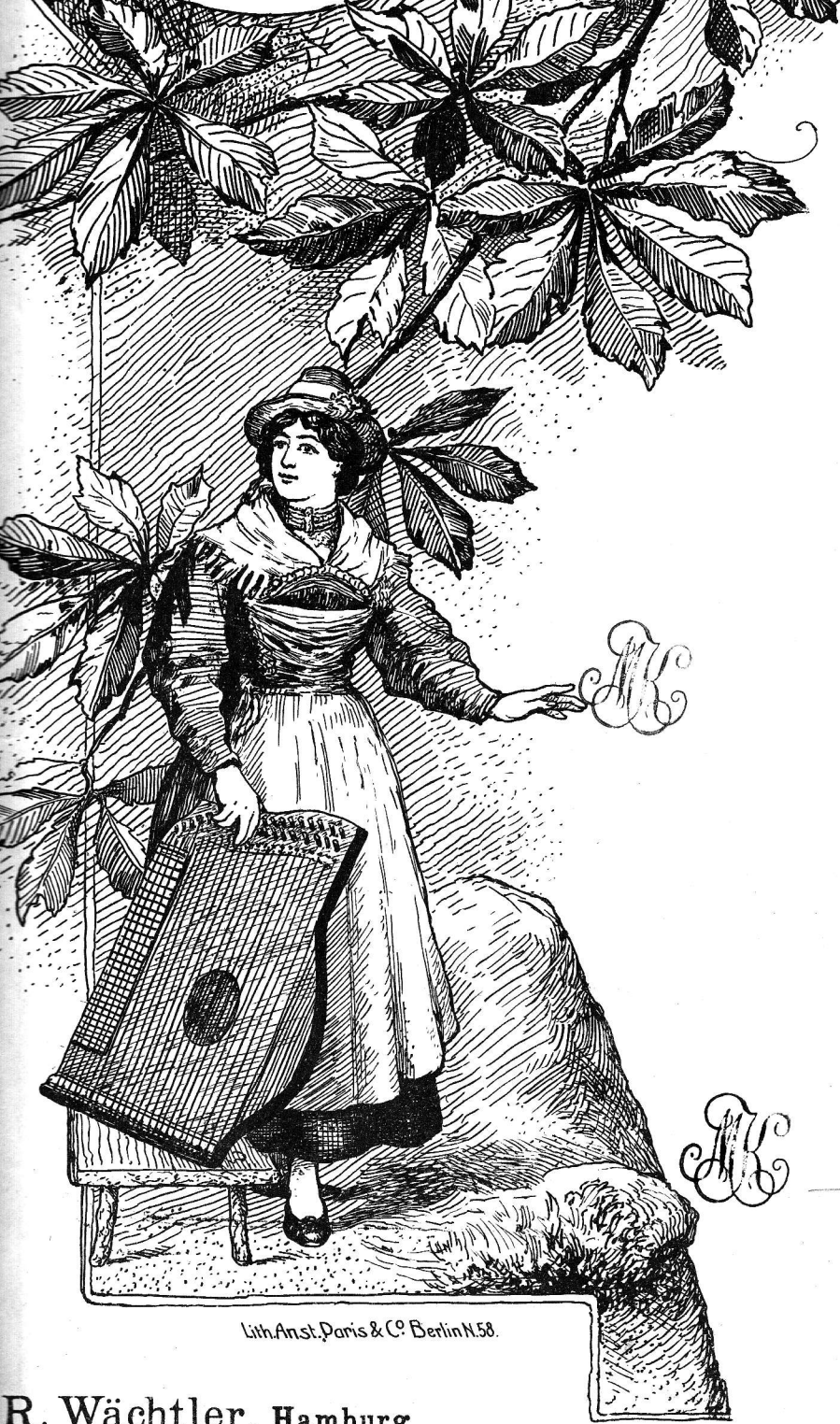
Lith. Anst. Paris & Co. Berlin N. 58.

Schulz, Max. Paraphrase über das Werner'sche Volkslied „Haidenröslein“ für Zither-Solo.